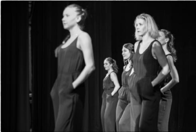
14 schwarze Leggings mit Oberteil in rot, blau, silber glitzernd